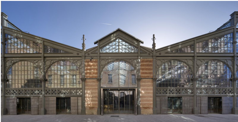
Le Carreau du Temple

Le Carreau du Temple est un espace hors normes qui rassemble et élargit le champ des possibles en s'affranchissant des frontières disciplinaires et sociales. Son objectif est de faire vivre, découvrir et partager les disciplines artistiques et sportives à des publics dans leur diversité, des amateurs aux professionnels. À l'image de sa programmation éclectique, le Carreau du Temple accueille une pluralité d'acteurs : associations, artistes, scolaires, voisins, chefs cuisiniers, chercheurs, enseignants... Tous ont ici leur place !